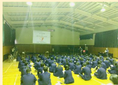
昨年度の介護の未来案内人の出張授業の様子