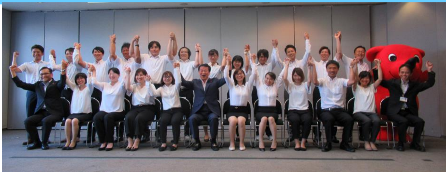
介護の未来案内人と森田健作知事(R1.8.9委嘱状交付式の様子)